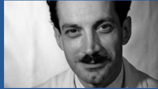
José Ignacio Barraquer Moner

Actualmente, el Instituto está adscrito a la Universitat Autònoma de Barcelona (UAB).