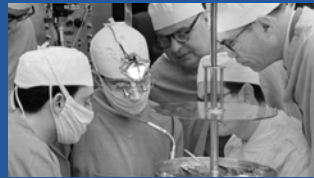
Joaquín Barraquer Moner

Se convierte en precursor de la cirugía refractiva gracias al desarrollo de una técnica con la que se podrá corregir quirúrgicamente la miopía, la hipermetropía y el astigmatismo. El procedimiento, conocido como queratomileusis, consiste en extraer una córnea defectuosa, congelarla, torPEARLA con la curvatura adecuada, descongelarla y volver a trasplantarla en el ojo.