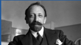
Ignacio Barraquer Barraquer

Funda la Sociedad Oftalmológica de Barcelona.